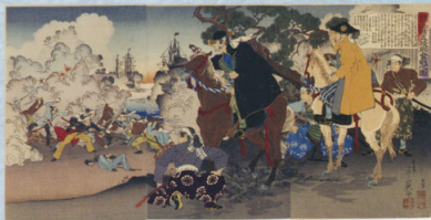
函館五稜郭奮戦之図